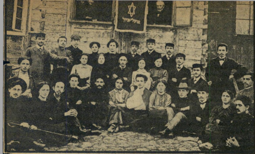
1906: פרידה מאבא בגיל עשרים החליט בן-גוריון (בחולצה הלבנה, באמצע השורה הראשונה) לעלות מפלונסק ארצה, ערך מסיבה לחבריו לתנועה הציונית בחצר בית אביו (הנראה מציץ מן החלון הימני). האב עלה ארצה בשנות העשרים, נפטר בארץ, בשיבה טובה, בגיל 87.