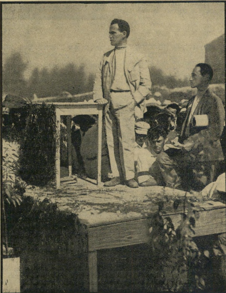
1924: מנהיג הפועלים ב"ז 1921 נבחר למזכיר הסתדרות ה"עובדים, תפקיד בו החזיק 14 שנים. בצילום: בן-גוריון לובש רובושקה רוסית לבנה, בטקס יריית אבן-הפינה לבית ההסתדרות.