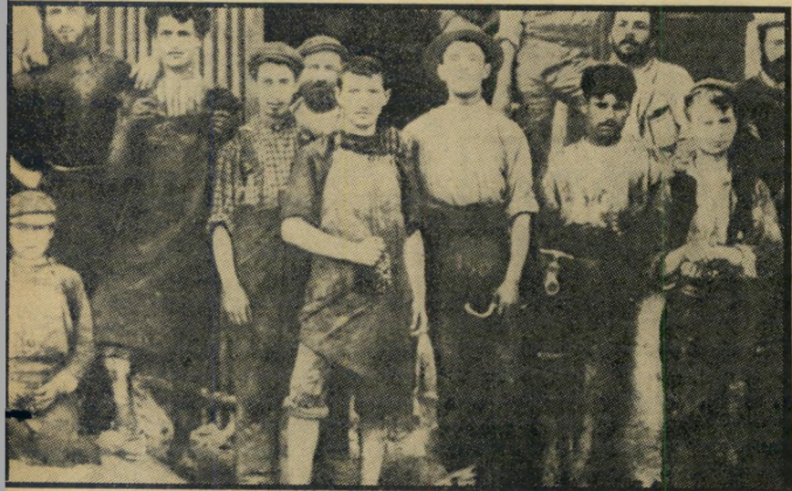
1907: שביטה בראשון את השנה הראשונה בארץ בילה ביגיי בפרדסי פתח-תיקוה ובראשון לציון, שם גם ניסה (בשורה הראשונה, לובש סינור ארוך) לארגן את הפועלים להסתבת תנאי עבודתם.

מאבא קיבלתי את אהבתי לעם ישראלי, לארץ וללשון העברית. אמא שלי מחה עלי בילדותי, כשהייתי בן עשר, אבל אני זוכר אותה היטב... סמל הסוהר, ה"אהבה, האצילות האנושית והמסירות."