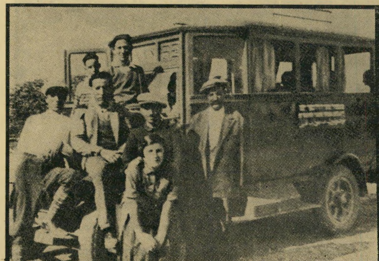
אוטובוס ירושלמי (1931) בכל מקום שעמד נוסע, תחנה

להוביל נוסעים לתל-אביב ולחברון. כאשר בנו את שכונת תלפיות, בירום העיר, רכש עוד מכונית, פתח לו קו פרטי משלו אל השכונה וממנה. מספר קמר: