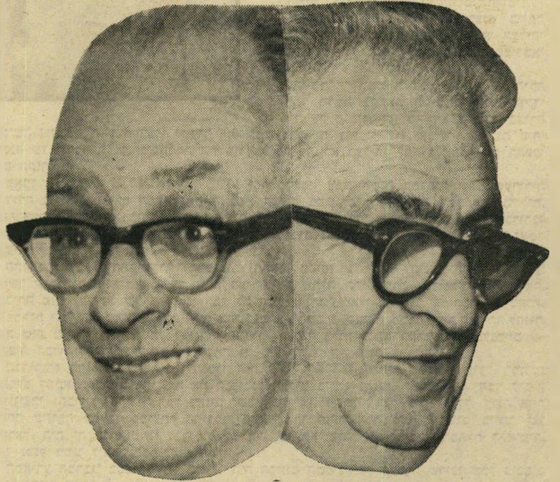
מלא והבנה מושלמת, שהתגבשה תוך שנים רבות. לתוך האחירה המשפחתית הזאת הכניסו הבורחים את הח"כ ה־120, שלא היה שייך למשפחה, ושקילקל את האינטימיות הכל־מפלגתית. נציג הכוח החדש, ח"כ אורי אבנרי , בעזרת יועצו, עורך־דין אמנון

הריבונות האמיתית במדינת ישראל אינה נמצאת בכנסת. היא נמצאת בפרוצדיה של מזכירי מפלגות, המקבלים את כל ההכרעות תוך התמקחות ביניהם. לכנסת לא נותר אלא לתת תשריר חוקי להחלטות אלה. בסידור נוח זה מעוניינות כל הסיעות, בקואליציה ובאופוזיציה כאחת. הכוח החדש, המפריע לכך, מעורר על כן רוגז כללי.