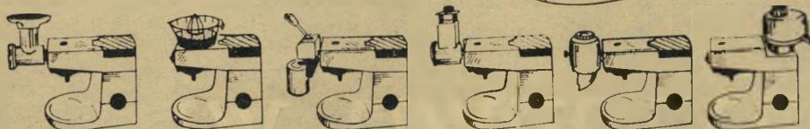
להכנת מיץ ירקוח לטחינת קפה לקיצוץ ירקות לטחינת קופסאות לסחיטת מיץ הדרים לטחינת בשר