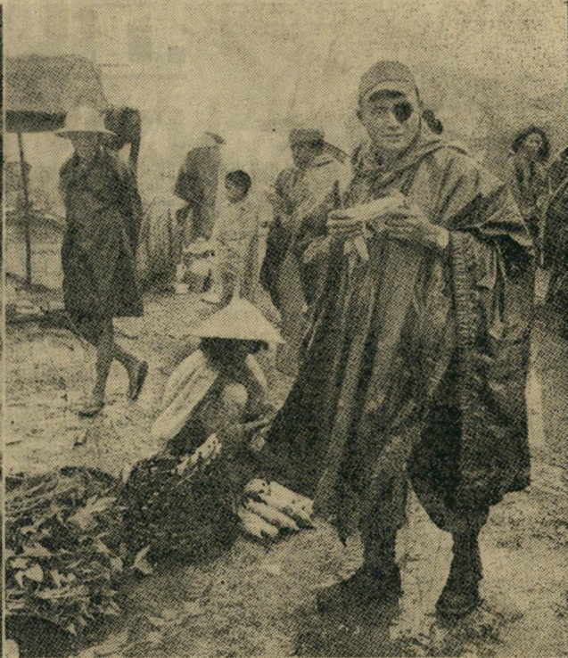
NOT CONTENT with remaining at base headquarters, Gen. Moshe Dayan, former C-in-C. of the Israeli Army, has gone out into the field to live the life of the ordinary Serviceman to get a first-hand appreciation of the war. His impressions are to appear in The Sunday Telegraph later this year.

He has spent days with jungle patrols, lying in fox holes and dugouts, sleeping rough in the open and cheerfully accepting the primitive facilities for washing and shaving. He has not neglected to study the effects of the war on the local people and while talking to vegetable sellers he sampled sweetcorn in a village market.