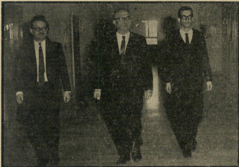
עתונאי שריד וראש הממשלה (משמאל: יועץ אביעד יפה)

בשיחה תרבותית. כהנתו של ה' מהנדס-המפיגן היתה להופיע עם כרזות גדולות הנושאות את הכתובת משטרת-ה'