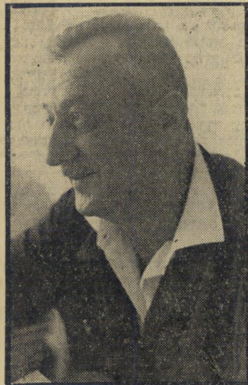
מנהל וידרא כולם אשמים

מלבד כל הטענות האלה, חווה וידרא עתיד עגום לחברת הספנות הלאומית תחת שלטונה של ההנהלה הנוכחית. לדבריו מן סלפת ההנהלה לא מאזן השנה שעברה,