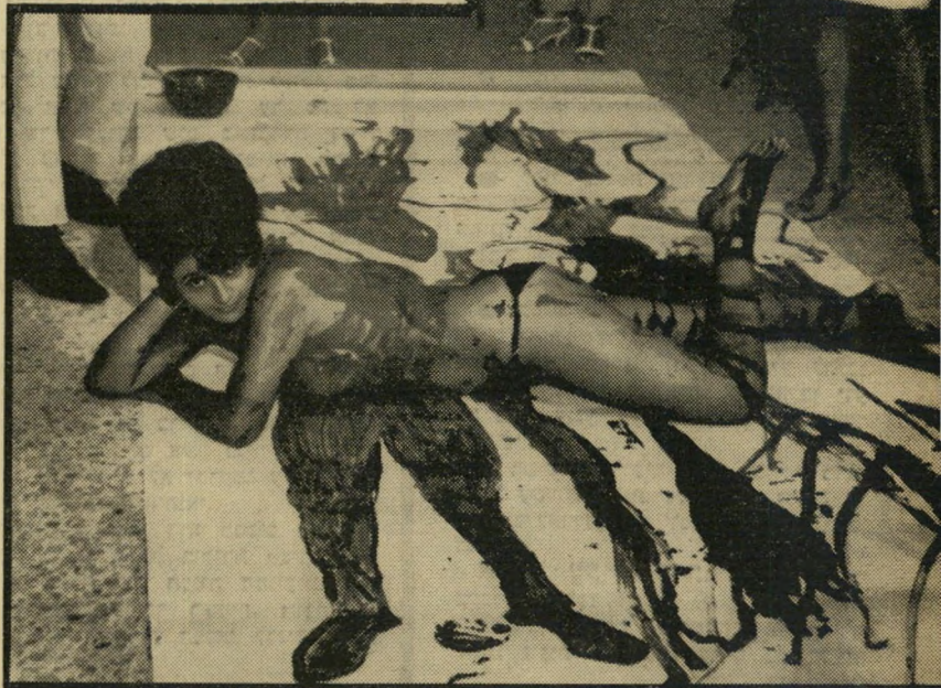
היצירה המוגמרת של חיליק. על הנייר אפשר לראות את הדמויות ש' הוסבעו בצבע, אחרי שהדוגמנית הוזה ממקום ל' מקום. היא עצמה צעירה תל אביבית, קרובה לאמנות, ולכן הסכימה להראות המאסטר.

"אל הקהל הם זרקו את העצמות והשיי רים, ובסוף, לקינוח סעודה, הם קיבלו על מגש בחורה ערומה בקצפת, וליקקו אותה עד שנגמרה. לקהל לא נתנו כלום." קמצנים!