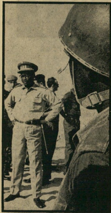
מובוטו (בישראל) הכל תלוי בטיב התלוי

כאשר ביצע הגנרל מובוטו, בחודש שעבר, את הרצח המשפטי בקינשאשא (הי ירועה יותר בשמה הלא-אפריקאי, ליאוי פולודויל) והוציא להורג בתלייה פומבית