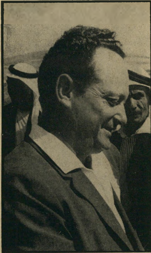
יגאל אלון: סיכון מחושב

הצעות אלה תמיד נדחו עליידי הנהגת מפלגתו - והוא ידע מראש שהם ידחו אותו.