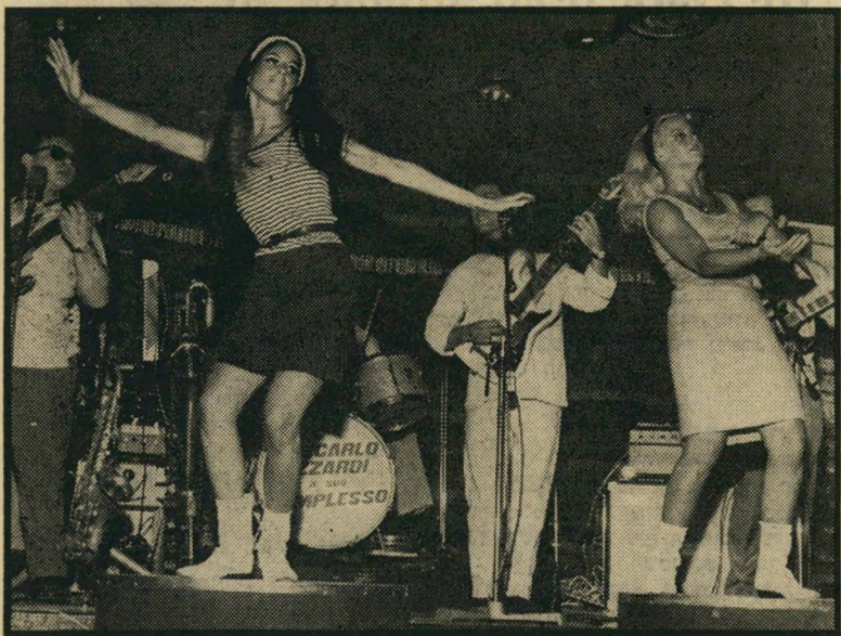
דיסקופצת קאופמן בפעולה הלוצה — מתמשכת — מקפצת

מן הארץ. הוא גם דורש עתה ממיקי 5,400 לירות, עבור החוקת הילדה וחינוכה במשך שנה וחצי. • איוה מזל יש ליפה: פיות כמו נערת ישראל יפה שרירי?! השבוע ביקרה במועדון'לילה יפואי, רקדה עם ידידה העתונאי אלכס גלערי, והב'