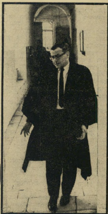
פרקליט שרף — פעמוני הכנסייה

מה, מי ומימת סדום. קבע מגדל שרף בטענותיו: „לא קיבלתי עדיין את כל חומר החקירה, אך הסניגוריה רשאת לדרוש מן התביעה לציין את הפרטים הידועים לה