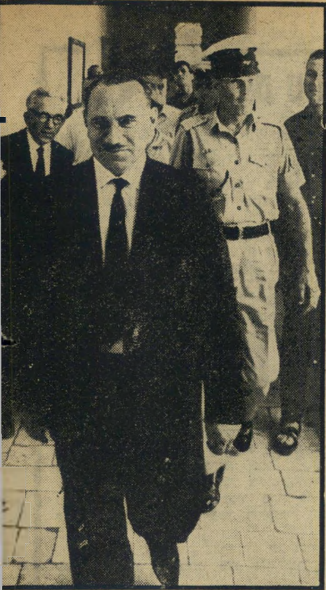
מדחי נכנס לאולם המשפט כפירה באשמה —