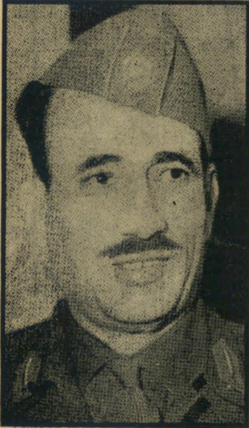
נשיא עארף המסקנה: לערוף ראשים

מיבצעו הגדול ביותר של עארף עבדאל-רואק נערך ב־1963. הגנרל הצעיר (39) היה או מפקד הבסיס האחירי הגדול של חבאניה, והוא שהורה למפציצי חיל-האחיר לתקוף את ארמונו של הנשיא קאסם. המטוסים הרסו כמעט לחלוטין את הארמון, קאסם נכנע, ו־במקומו עלה לשלטון עבדאל-קאסם עארף. אפשר היה להניח, שבחירה זו תשביע את רצונו של עבדאל-רואק, כי גם הוא וגם עארף צידדו בקשרים הדוקים עם מצרים, ונוסף לזאת היו השניים גיסים. ואמנם, עבדאל-רואק הגיע, כעבור שנתיים, למישׁרת ראשי־משלת עיראק. אבל הנאמנות לגיסו לא היתה חזקה כל