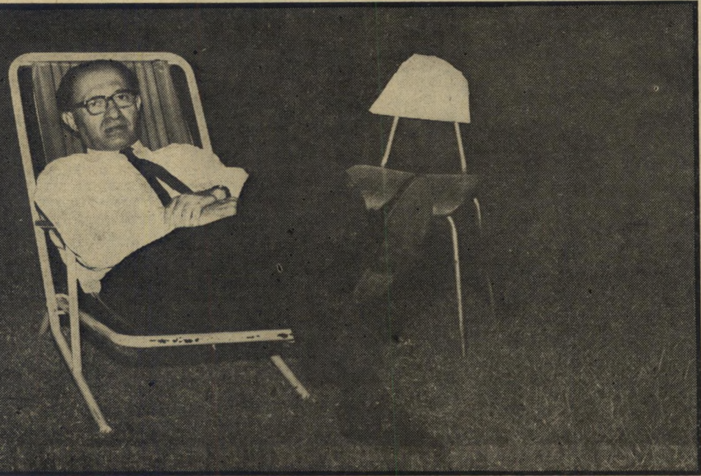
בודר ועיף, מתכוון מנחם בגין לנאום הגארתוני שלו שנמשך שלוש וחצי שעות

„יש ארבעה כיסאות בבית זיבוטינסקי, אי-אפשר לחלק אותם לכולם. אתם לא תגיעו לשם, אתם רק בשר תותחים בשביל אלה שרוצים לשבת“, הרעים ציר בעל שפם גדול מאוד, חבר מושב בית-ניר. על הדשא של כפר המכביה פזורות קבוצות רבות. כשמתקרבים, שומעים קטעי שיחה מוזרים: „אנחנו 20 והם 22, אז למה לנו יש רק אחד בוועדה ולהם יש שניים?“ תשובה של איש מבוגר יחסית: „נכנים אותך לוועדת הנוער והספורט.“ ההפסקה נגמרה. תמיר עלה לנאום. הוא סיפר לקהל שהנשיאות שללה מגידו את רשות הדיבור. סערה גוראה, אבל זה שוב