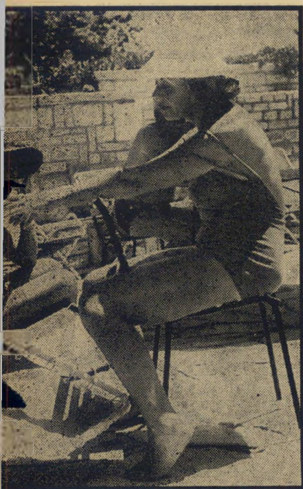
ח"כ ארנון אין בטלה