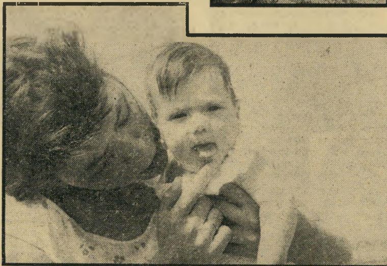
מתיישבי יודפת ומיגדליהתצפית תורת-חיים מיסטי

שם מקצועות ספרות ואמנות. תוך כדי לימוד גילה שהתרבות של ימינו מרחיקה את האדם מהחיים האמיתיים, ומצא דרך לחזור אל החיים, בתרבויות המיסטיות של ה" מורה הרחוק, בון וביוגה. אחרי שהתגבשה אצלו תורתו החדשה, הוא מצא לה גם מאמינים שהסכימו לצאת ולהגשים אותה. ה" מאמינים עלו ליודפת כדי להתקרב אל ה" אדמה ואל הטבע.