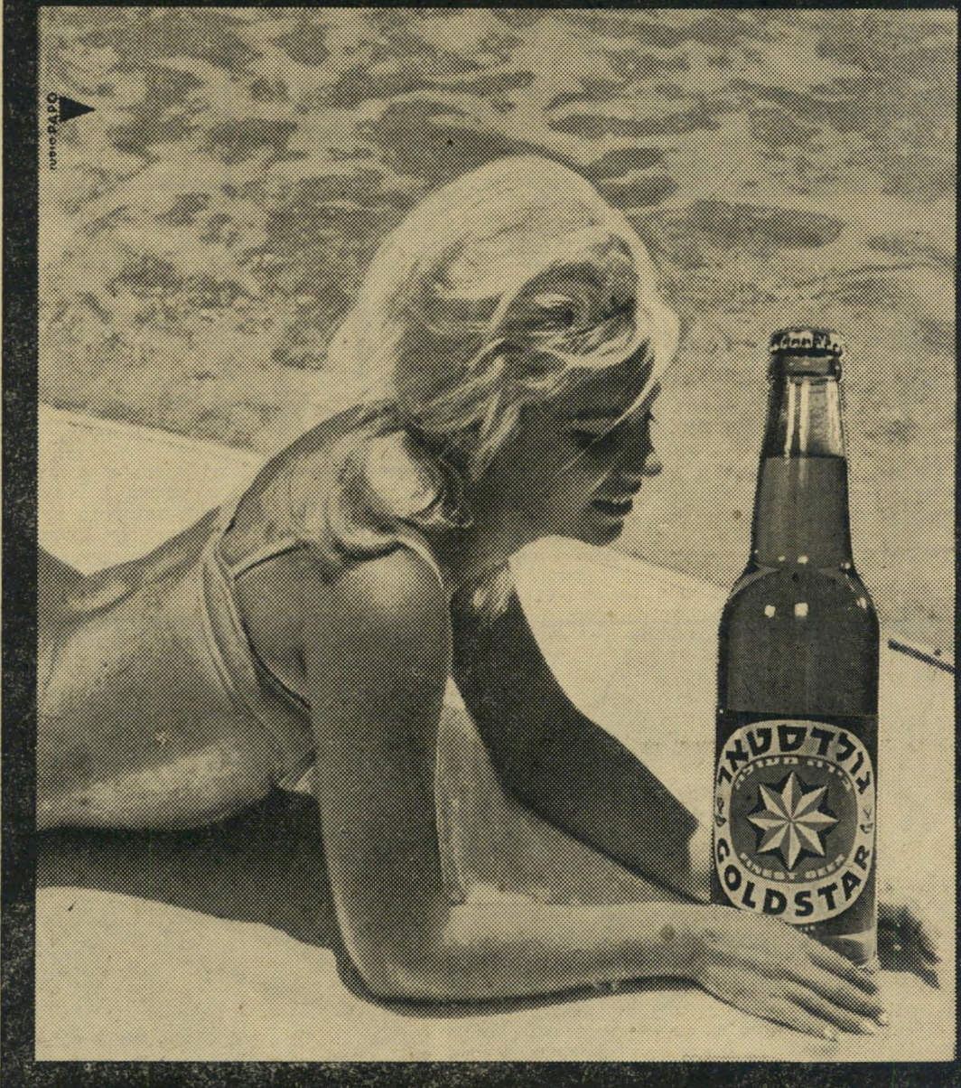
פרסום א. אריאלי