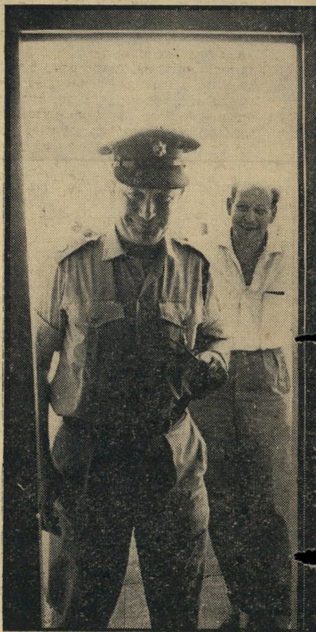
עד תדמור (מימין) "אני לא נתתי לו רשיון"

ביום החמישי נערך בפארק הי לאומי ברמת-גן יום הסוס, שאורגן עידידי אגודת חובבי הסוס בישי