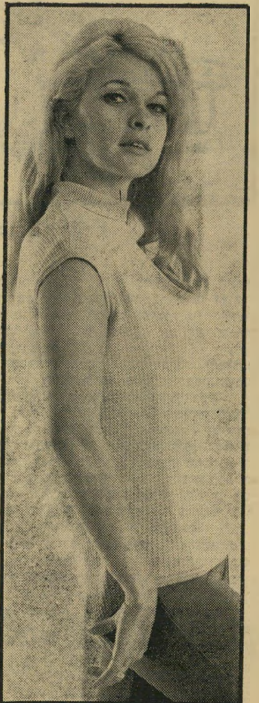
דוגמנית טוכטרמן עירום? רק בטעם!

עכשיו הוא עושה יחד עם צפלי את הסרט הראשון שלהם. אם הסרט יצלח, יצטרפו לחפש באיטליה רופא אחר שימלא את מקומו.