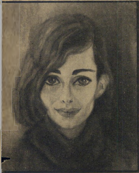
„אשה“ של רענן קץ לזהות מפוצלת

קונסול ישראל במונטריאול, דויד ריבלין, הביע זאת אחרת: „זה תענוג לפגוש כאן צייר שלא צריכים להחזירו הביתה על חש-