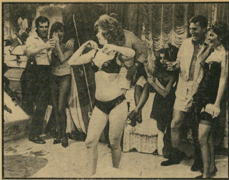
התחלת האורגיה ב"אמריקה לאן?" מה שאסור בארצות-הברית -