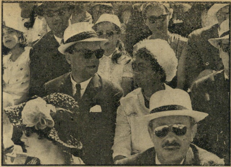
שגריר פאולס ואישתי במיצעד הדיפלומט המהודד