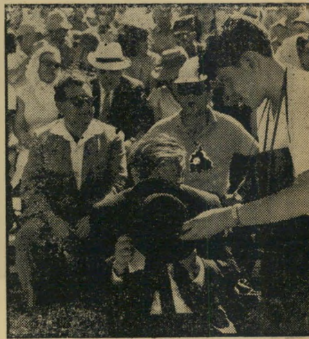
השופט אגרנט מדריק מקטרת — הליפה שחורה הדורה

● דידי מנוסי : „דו"ח מבקר המדינה הוא ביובזו כספי הציבור, לא פחות מכל הכיבוזים האחרים שהוא מתריע עליהם — איש לא יקרא אותו ולא יתחשב בו בין כה וכה.“