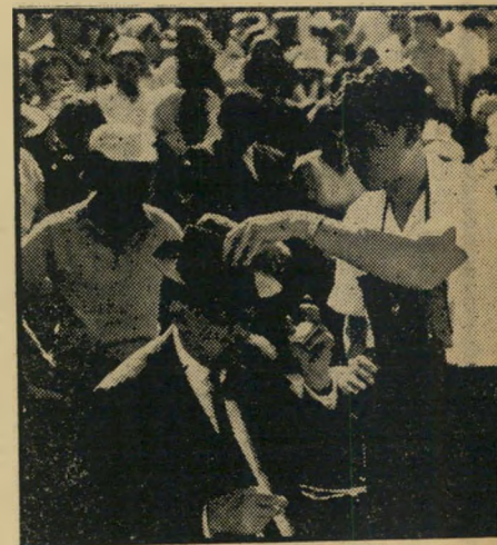
— ובנו מחזיר את המגבעת מגבעת שחורה מתאימה