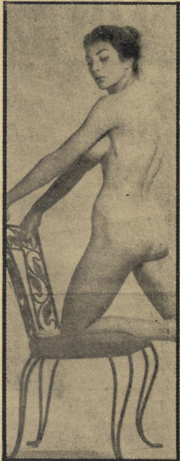
1959: תמונות העירום יחסים הדוקים

החמיצה זיוה את הרכבת. היא כבר מזמן יצאה מן המחזור. סיבה נוספת היא, ששחקניות ישראליות הצליחו גם כשהיו פחות מיוחדות ומוצל־ חות ממנה — משום שנראו ישראליות. זיוה, לעומת זאת, היתה ישראלית רק באופן־ פורמלי. למעשה גדלה ותונכה בארצות־ הברית, והיתה מוצר אמריקאי טיפוסי גם כחצי-צונניותה. עד כמה לא הבינה זאת — מעיד הפרק