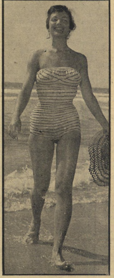
1952: נערת זוהר סמל לאומי

הו ההסבר לכך, שזיוה שפיר־רודן, שהיתה נערת־הנוהר הלאומית הראש־ נה של ישראל, הנערה הנהדרת, הנחשקת, הנפלאה, שכל אחד בארץ שמע את שמעה, שעשרות נערות ניסו לחקות את תסרוקתה המיוחדת ואימצו לעצמן את שמה „זיוה” — כיצד קרה שדווקא היא, מלכת הזוהר — הגיעה לתחתית הסולם, לדרגה כה ירודה, שאף ישראלית אחרת מעולם לא הגיעה אליה?