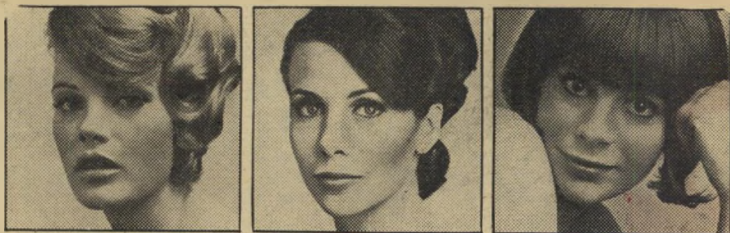
Tender Peach/Aurore Doree/Opaline

אני מצפה מכם שתגלו תבונה ותתייחסו בהבנה לתנועה החדשה.