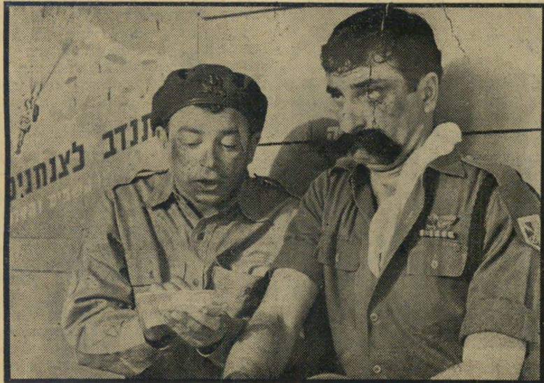
זינגר ובודו ב"מוישה וונטילטור" חמש פנינים

בני משה קרסו בע"מ רחוב ריב"ל 24 טל. 33241 ת-א