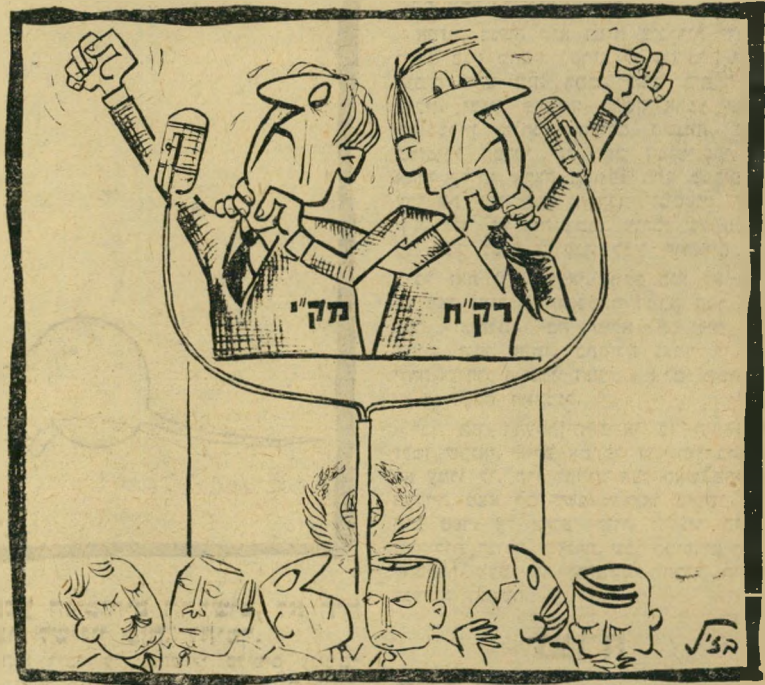
"ועכשיו תשמיע המשלחת הישראלית דברי ברכה..."

חגי-הפסח הוא חג עתיק מאד, שהיה קיים בצורה זו או אחרת אצל כל העמים הפרימיטיביים — חג הטבע, חג האביב. אצל בני-ישראל הוא התקשר באגדת יציאת מצרים. ואם כי טיבה של האגדה אינה ברורה די צורכה, ועד היום מתווכחים חוקרי המיקרא מה מידת האמת ביציאה ההמונית של שבט נדבא מממלכת פרעה — אצל הירודים קשור חגי-הפסח בשלוש מילים: "שלח את עמי". בפסח תשכ"ו מתקשרות שלוש מילים אלה ביהודי ברית-המועצות. מדוע? זוהי אחת הבעיות המסובכות ביותר בעולם המודרני. כי לשלטי הקרמלין, בניגוד לפרעה, יש אידיאולוגיה המונעת מהם במפורש להתיר לאזרחים טובי-יישנים להגר. זכות-ההגירה היא אחת הזכויות המקודשות של הדמוקרטיה הליברלית. לפיה, יכול כל אדם להצטרף לכל אומה, לעבור לכל מדינה כראות עיניו. כי האדם הוא ה