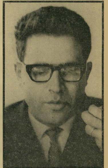
סופר מנצור בדרך לקיבוץ

מעל לכל מגלה הסיפור, המסופר כולו בגוף ראשון, מה מתחולל בנפשו של צעיר ערבי שחולל ללכת בדרכי אבותיו, ושואף