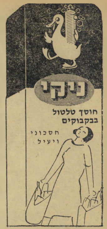
כשר לפסה תוצרת בית"ר נקה בע"מ