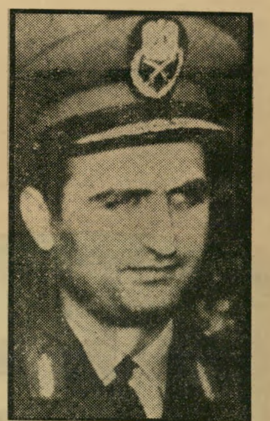
הכיכין ג'דיו מאחורי ההפיכה

אולם מתחת לאפם של האלופים היתה המפלגה הסוציאליסטית, הטוענת להנהגת המהפכה בכל העולם הערבי, עסוקה בכיבוש עמדות-המפתח של העמית בתוך הצבא. ה'