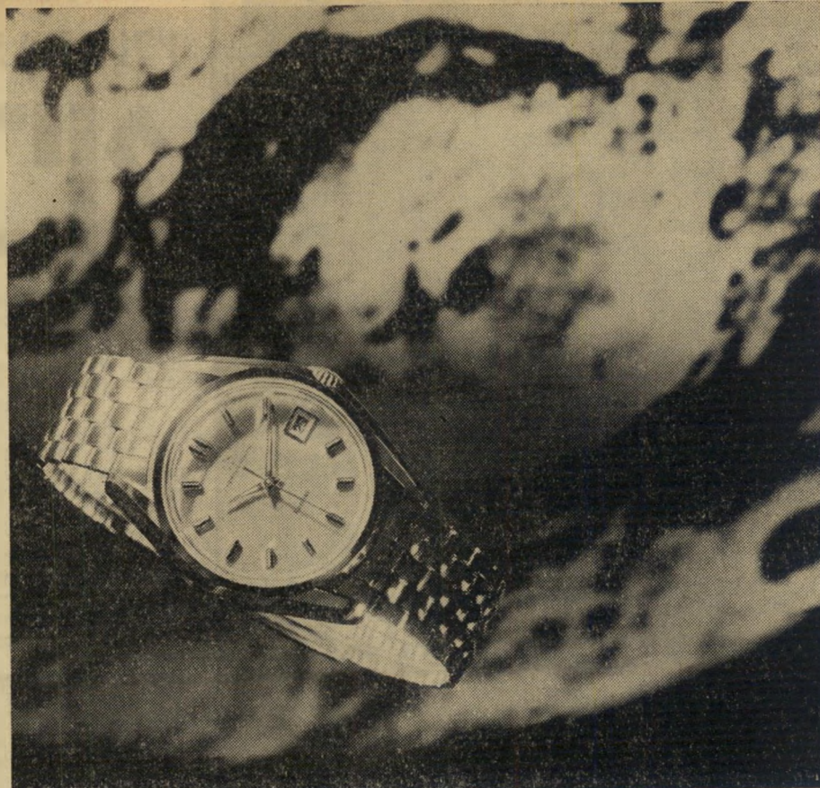
Ref. 130TT-1424 with sunken crown (illustration enlarged 1.0 x)

עד כאן סיפור המעשה. עכשיו על ה' משטרה וחברת הביטוח לבדוק היטב אם היתה פה הצחה, או שידהמיקרה גרמה לשריפה.