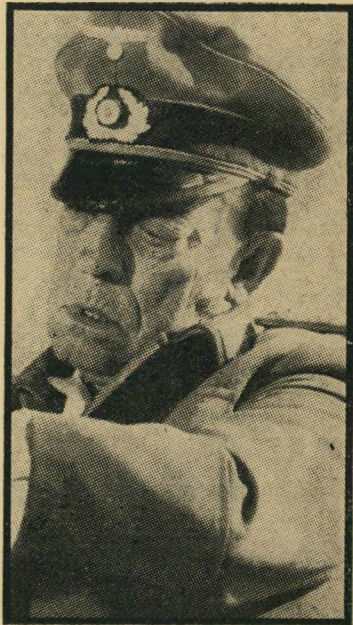
באסטר קיטון (בסרטו האחרון) פני פוקר

ועד היום נחשב לאחד הכוכבים הגדולים בתולדות הראינוע.