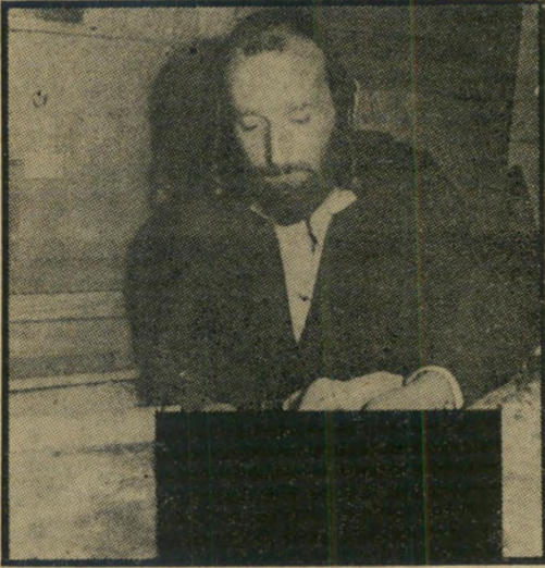
תמונות זיזעה של „כבוד המת“

יהיה צורך לברר אם כל העצמות הן של יהודים כשרים, או שיש שם עצמות של יהודים שהאמא שלהם לא התחננה כראוי עם האבא