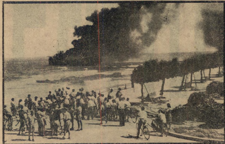
"אלטלינה" בווערת מול חוף תל-אביב

טיין. שום חייל קרבי דאז לא היה מסכים לכך.