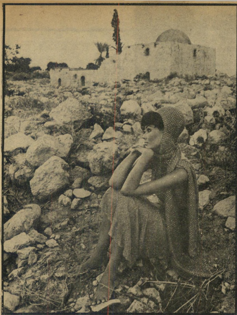
דוגמנית צרפתיה בנוף הארץ ההצגה נגנבה