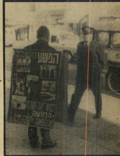
שוטר מגיח מניידת רצח גרמני