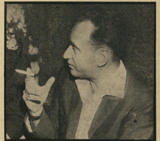
ח"כ אליאב רחמים

ה עילה לוויכוח היתה, כזכור, הצעת הממשלה להעניק לשר-הפנים את הסמכות השרירותית לסרב מתן דרכון נים ולשלול דרכונים מאזרחים כדי למנוע — כביכול — בעד עולים חדשים מלרדת מיד עם קבלת האזרחות. הצענו לנקוט בדרך הפוכה, מכובדת יותר: להפסיק בכלל