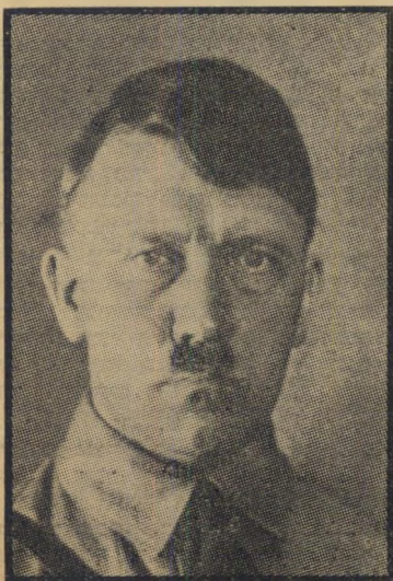
האב: אדולף היטלר

א ת הראיון המתפרסם הלן היא העני-קה לפני שבוע לעתונאי צרפתי, בירת ארוסה, פיליפ מרווין, בסך גרמן שבפאריס. על הדירה שמו שתי "גורילות" - כפי