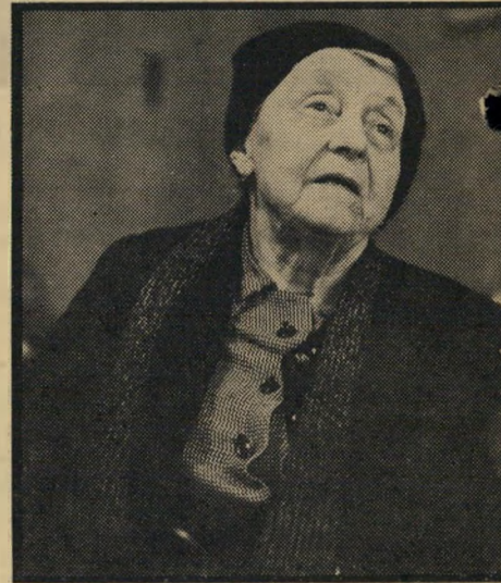
אמו של סרק

תחילה הזמינו צחת של עתונאים גרמניים, נציגי השבועון ההמני קוויק. לפי בקשתם, צורף לצחת זה עתונאי ישראלי השוהה