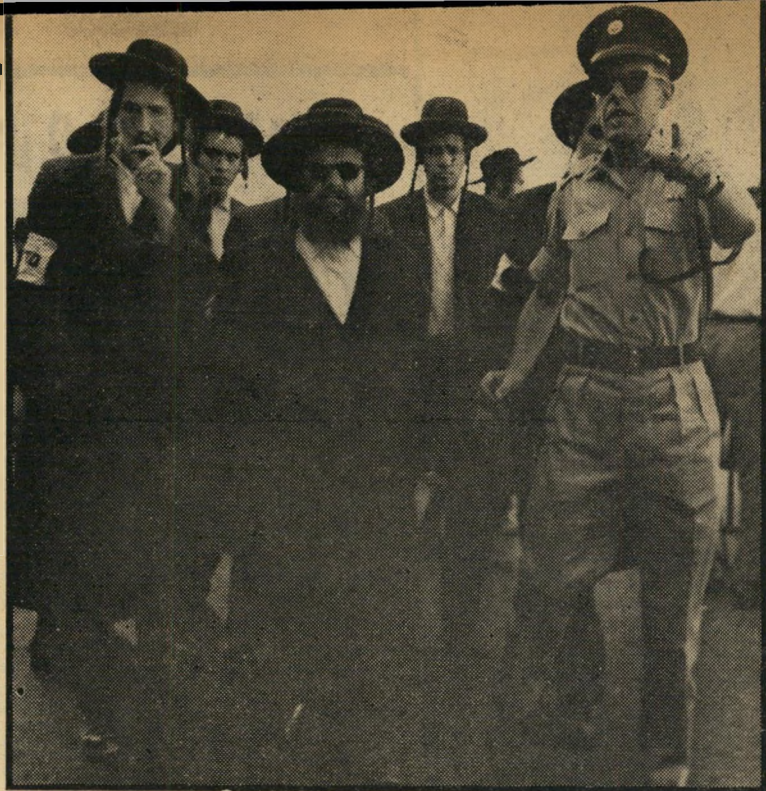
הקצין יוצא לסיר מוקדם עם הסדרנים

תמונות אלה צולמו לא מזמן, כאשר הגיע לביקור ארצה הרכי מי סאטמר. למשטרה היה ברור מראש, כי יהיה לה קשה מאד לשמור לבדה על הסדר. על כן גייסה את אברכי הישיבות, והפכה אותם למעין שומרי-עזר. אם מחר תיאלץ משטרת-ישראל לחסום את כל הכבישים, ולאסור כל הפעה בשכר, לא מן הנמנע כי שוב תפנה לבחירויהישיבה שימשו שומרי-עזר נגד האזרחים החילוניים, העשויים להתנגד לחוק.