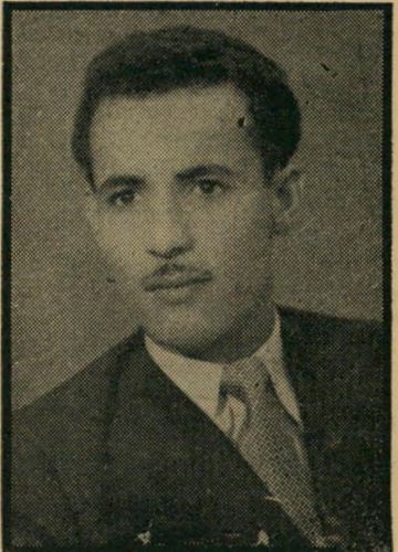
נאשם יסין למה הש"ב אדיב?

הטענה האחרונה כשעלה השבוע המסך על המערכה ה- (החשך נעמוד 26)