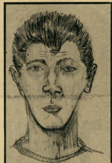
ציוור החשוד למה מוכשר החבר?

הוא נפגש עם מרשו, הציע לו לספר לחוקריו מה מסתתר מאחורי הגיבעה — כלומר, על מה מדברים חבריו, האסירים הבטחוניים, איזו אינפורמציה מתהלכת חופ-