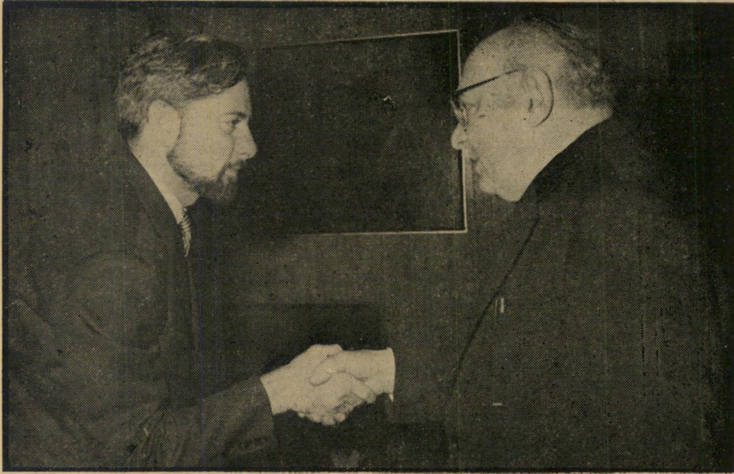
נשיא המדינה לוחץ את ידו נציג, סיעת העולם הזה - כוח חדש

זה לא קל, כי בכל סיעה מחולקת עבודה זו בין חברים רבים - ואילו סיעת העולם הזה - כוח חדש יכולה להטיל את המלאכה רק על איש אחד, שיצטרך לעסוק בעניינים שונים ומשונים, מכל שטחי החיים. הדבר אפשרי רק הודות לעבודת-הכנה מדוקדקת, בניצוחו של אמנון זכרוני.