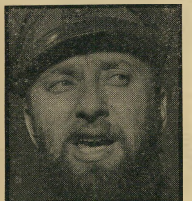
פרקליט בסוק ההריון נמשך, ממזר אין

יודך הריון חיים מנחם בסוק מתייחס אל הממזרים כקודמיו. הוא יצר לעצמו, אפילו, אידיאולוגיה של עקיפת החוק. דע' תו: "אינני חושב שיש הרבה ממזרים. ה-