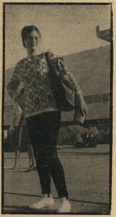
המכנסיים הם המיץ המבוך קש ביותר בקריה. אז מה הפלא שחן באות במכנסיים?