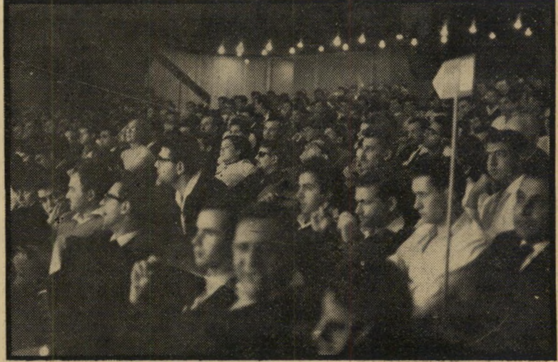
הפעילים ליד שטי החטיבות האזוריות — באנו להוכיח שאנחנו ממשיכים לפעול