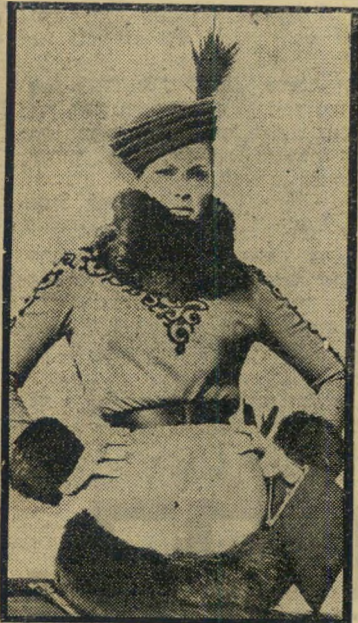
אנדרסן עד הפה

הזמר שארל אזנאבור נשאר עדיין האדם היחיד בעולם-הקולנוע שלא הספיק להיות גיימס בונד. הוא ממחר לתקן את המעוות, הוא יהיה סוכן חשאי 00. בסרטו