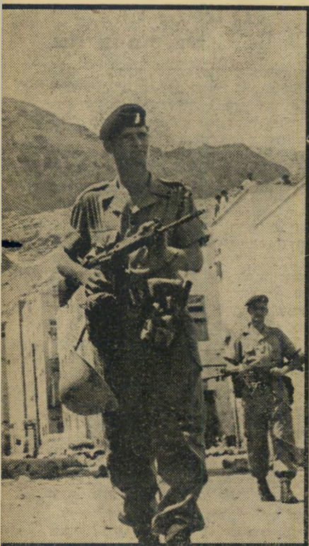
לפני הסוף נגד שלטון בריטי — לפני צאת החיילים.

מה שקורה בעדן עכשיו הוא בדיוק כפי שקרה בחיפה בימים ההם, לפני 48 שנה. ספר פליט פלסטיני, תושב חיפה ל-שעבר, שהתגורר בעדן, ועבר לאחרונה ל-גיבוטי, כדי להשתקע — בעתיד הקרוב, על כל פנים — תחת הדגל הצרפתי. "זורקים פצצות, יורים על חיילים אנגר ליים ברחוב, האנגלים עושים עוצר, העסקים רעים. אני לא רוצה לעבור עוד פעם את כל העניין מחדש".