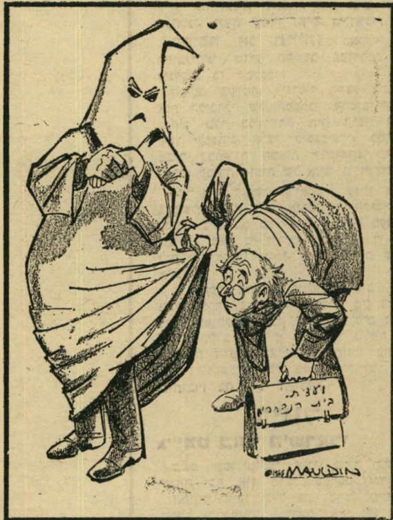
„אל תצוץ!“ (קארקטורה של מולדווין) הרוצחים חייבו

השפאל והקומוניסטים, החליטה לחקור את פעולות הקונקורב־קלאן. היא הזמינה בסניה את מנהיגי הקלאן. מתוך השאלות נסתבר כי הם בעלי עבר מלוכלך והחזו מוזהם: המנהיג הארצי גורק מהצבא האמריקאי כבושת־פנים, גנב את כספי האירגון למטרותיו הפרטיות, מנצל את האירגון לשם ביזנס פרטי. בין השאר הוא מוכר לחברי־האירגון את המדים ה־מפחידים של הקלאן, הדומים לסדינים ר־למסיכות־ראש, אך העולים בכסף רב. יהודים וקומוניסטים. על כל הי שאלות סירבו המנהיגים להשיב, תוך שי־מוש בזכותם החוקית שלא להפיל את עצמם. אפשר היה לחשוב שזה יזיק להם כי עיני אוהדיהם, אך אלה, כמו הפאשיסטים בכל הארצות, לא זועזעו עלידי הגילויים. „הכל שקר“, הם טענו, „וזהי קניניה של יהודים, כושים וקומוניסטים כדי ל־השחיר את המדים הלכנים של הקלאן“ השאלה לא נס־תרה — ובינתים מופיעים הרוצחים שזוכו בעצרות־המור גיות, מתקבלים על־ידי המונים כגיבורים לאומיים.