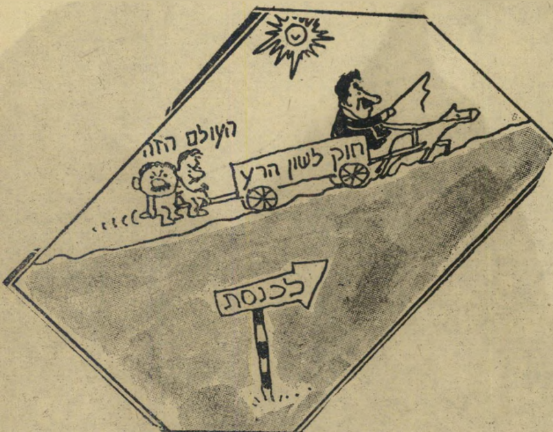
רענן לוריא ב"דיעות אחרונות"

במשך שנים רבות חזרו וניסו כל שר-תפי המישטר לטעון, כי העולם הזה אינו רציני, שהוא אינו מייצג בארץ שום דבר, שקוראיו הם עדת פוחזים. אבל הם לא הצליחו לשכנע אפילו את עצמם. על כן נקטו בקו השני: הם החליטו להתעלם