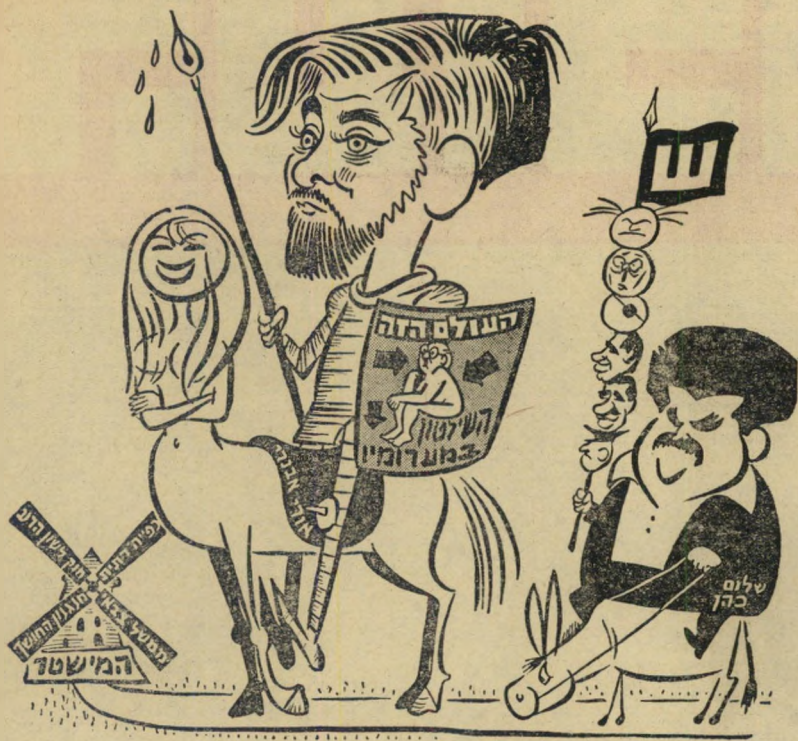
זאב ב"ה הארץ"

בכל הבחירות הקודמות מילאו כתבי העולם הזה ועורכיו תפקיד מיוחד: הם ישבו כמטקיפים בקלפיות, ברחבי הי' ארץ. במשך יום הבחירות ייצגו את הי' מפלגות השונות בקלפי, ובצורה זו עקבי מקרוב ובצורה בלתי-אמצעית אחרי התה-ליך הגדול, גם ביום שלישי האחרון ישבו חברי מערכת העולם הזה בקלפיות, ברחבי הי' ארץ. אך הפעם עשו זאת מטעם רשימה אחת, וזו נשאה את שם העתון שלהם: רשימת העולם הזה — כוח חדש. כך שילבו שני תפקידים: הם מילאו תפקיד ציבורי חשוב מטעם הרשימה, והם כיסו את הבחירות כעתונאים. את הרו"ח שלהם,