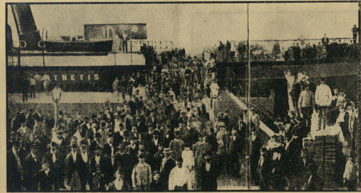
מצד האב: הסבא מגיע לארץ-ישראל עם העלייה השנייה

בראשית המאה והתיישב ביפו. מצד משפחתו מיוחס האב אף למשפחה החיה בארץ-ישראל מראשית המאה ה-18. בשאלו שלום ירושלים — ספר קטן שכתב בראשית המאה ה-18 ר' גדליה מסמיאטשי, אחד מתלמידיו של ר' יהודה החסיד — מתוארים סבלותיהם של תושבי ירושלים בצבעים חדים. מתיאורו של המחבר ניתן ללמוד שחיה של קהילה זו היו גולה שהיתה גלולה מרה, כיצד היו מתנכלים ליהודי, כיצד היה נאלץ היהודי ללבוש בגדים מיוחדים ולפנות דרך לכל ישמעאלי (תורכי) שפגש בדרכו. הספר נכתב בכאב של בן לעם שהעניק לעולם את רעיון החופש, את אושיות המוסר, הצדק והמשפט, ובין שורותיו מובעת התקווה שיום יבוא והכל יהיה שונה.