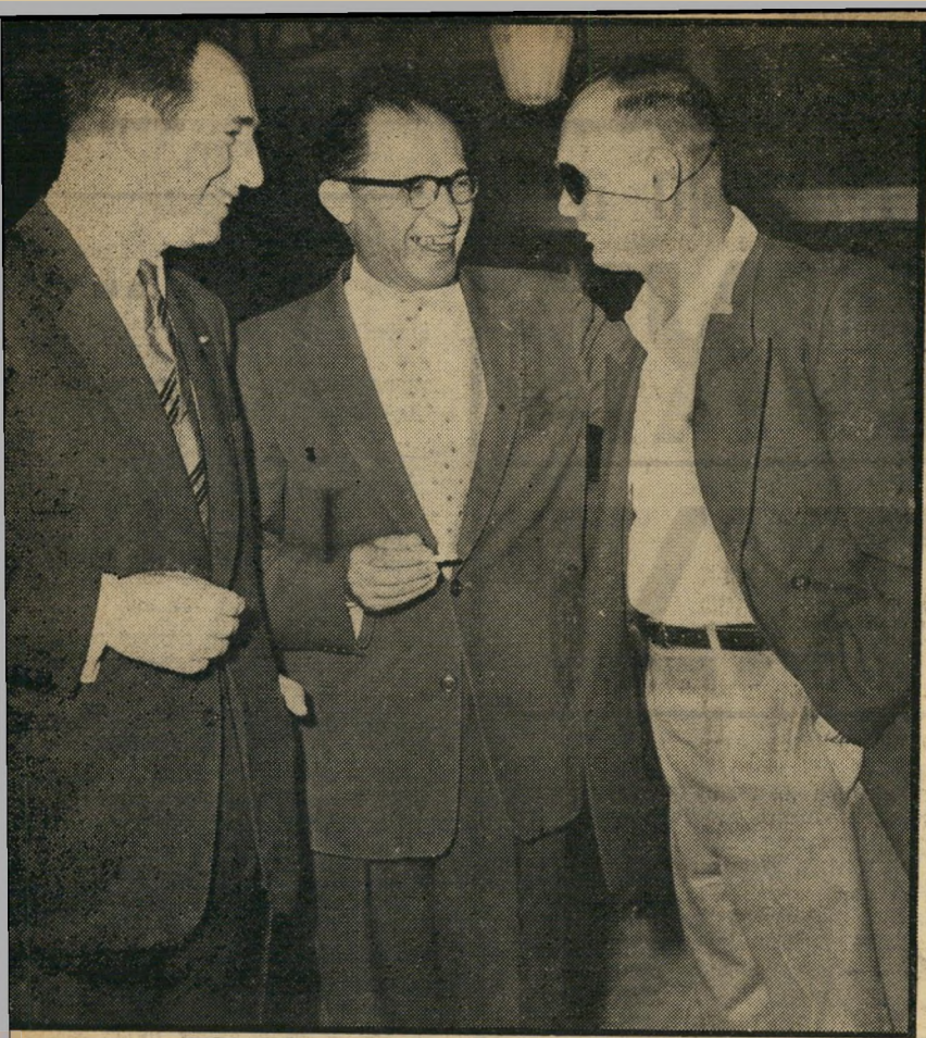
מנחם בגין עם משה דיין ושמעון פרס חרות ופ"י?