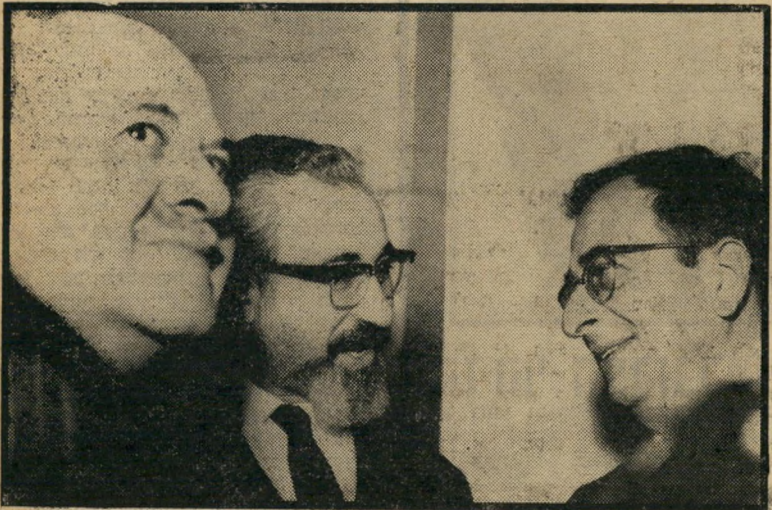
יצחק נבון, שלמה לורנץ ומשה סנה רפ"י, אגודת ישראל ומק"י?