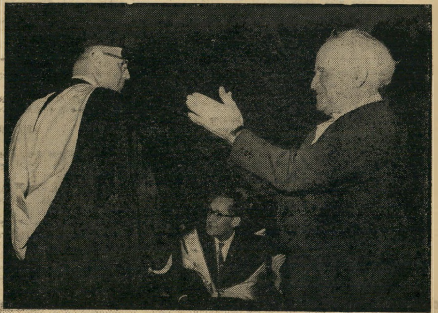
דויד כ"גוריון ואבא אבן רפ"י ומפ"א?