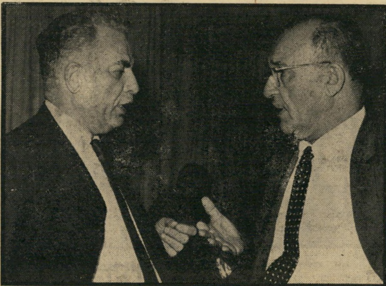
לוי אשכול ומשה שפירא מפ"י והמפ"ד?

מנשק את היד. אני בעד הדתיים, סוף כל סוף אני נכדה של רב. אני אוהבת את מנהיג מק"י שמואל מיקונוים, אותו אני מכירה מילדות, כשהוא היה עדיין שחקן באוהל". ● במלון הילטון, נקטת חברו משה כרמל, שלא הירשה להכנס להילטון ללא עניבה. גלילי דווקא נכנס לשם ללא עניבה, לבוש חולצה לבנה עם צווארון גדול ופתוח. דווקא. ● ערב ה" בחירות מצאו כמה צלמי עתונות שעשוע מיוחד. כל אחד מהם נכר בארכיונו, שלה ממנו תמונות של עסקני מפלגות, בנסיבות שונות. המטרה: לבטא בתמונות אפשרויות שונות לקואליציה העתידה. ה" זוכה בטוטו קואליציה זה. יהיה אותו צלם שתמונתו יתאימו להרכב הקואליציוני ה" בא (ראה תמונות).